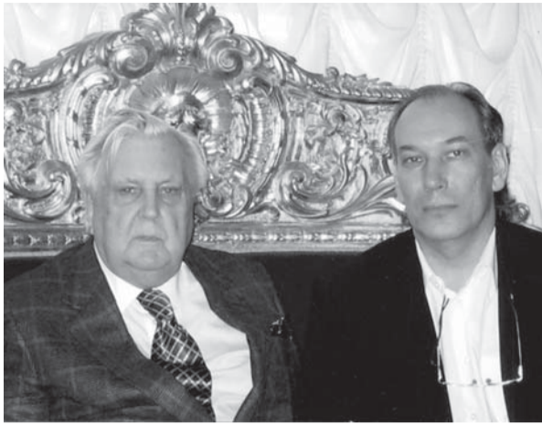
Художник И.С. Глазунов и писатель Р.Л. Перин Москва, 2012 г

Я - националист. Шовинист бы сказал, что мой русский народ самый лучший из всех других. А я как патриот утверждаю: русский народ не хуже других. Но я горжусь, что я русский.