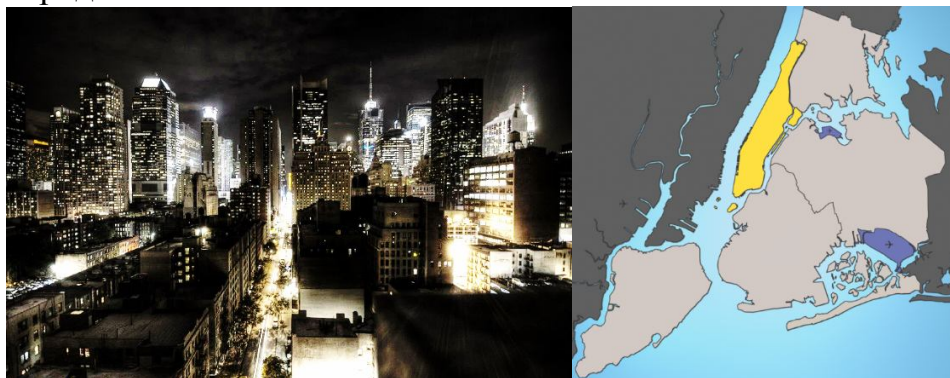
1.Ночной Нью Йорк, слева внизу темный малоэтажный Харлем. 2.Харлем на Манхэттен.

Район притянул к себе предприимчивых Английских, Итальянских и Немецких дельцов, наполнив его магазинами любого вкуса. Естественно, это был лакомый кусочек для нанятых на работу в порту «черных грузчиков». Они часто совершали туда набеги и до тех пор, пока терпеливые жители просто-напросто не бросили свои дома, оставив новым хозяевам превратить их в хлам, в теперь знаменитый черный Харлем. А ушедшие перебрались в другие районы и построили новый Нью Йорк с его небоскребами, вокруг разоренного в самом центре города.