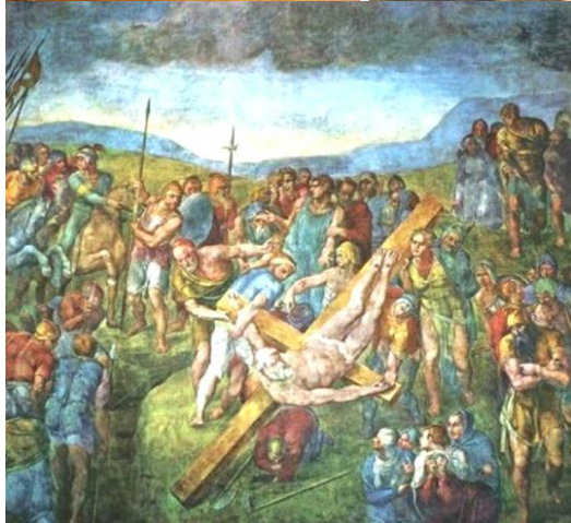
1. Апостол Пётр и больные исцелялись его тенью (Бракаччи): «так что выносили больных на улицы и полагали на постелях и кроватях, дабы хотя тень проходящего Петра осенила кого из них» - (Деян. 5:15). 2. «Камю грядеши» (Аннибале Карраччи) – «Domine, quo vadis? - Боже мой, куда идешь?». 3. Распятіе Петра (Микель Анжело, 1499,