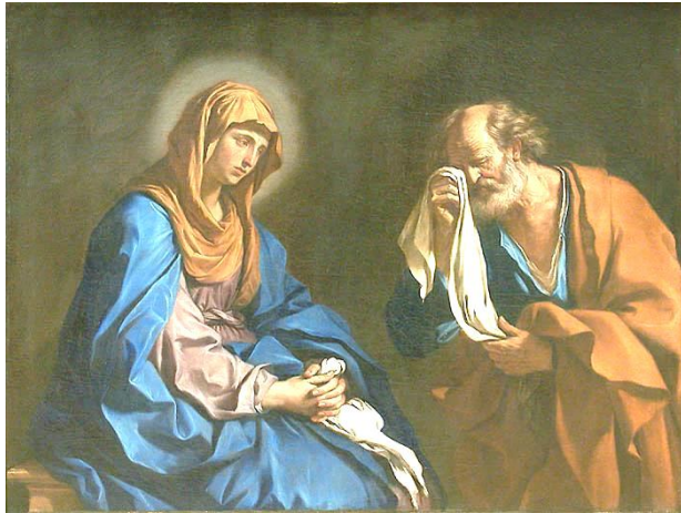
1. Апостол Пётр (Рубенс). 2. Петр и петух (Карл Блох). 3. В слезах Симон Петр кается перед неутешной Божьей Матерью о своем трехкратном отречении.