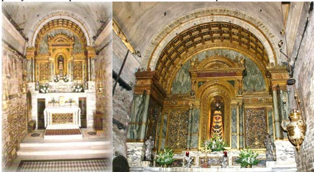
Истинная комната Благовещения в храме Лорето

И уже сегодня можно найти полную и достоверную информацию на Русском в Интернете о Чуде Лорето , своею святостью приравнено только ко Гробу Спасителя в Иерусалиме. Радует, что теперь такие Святые места помещаемы Русскими Православными, и что их становится всё больше и больше, не смотря на непрекращающиеся злопыхательные отзывы и подстрекательства всё тех же Врагов Христианства. Только печально, что их лица и рассуждения приходится нам видеть до сих пор.