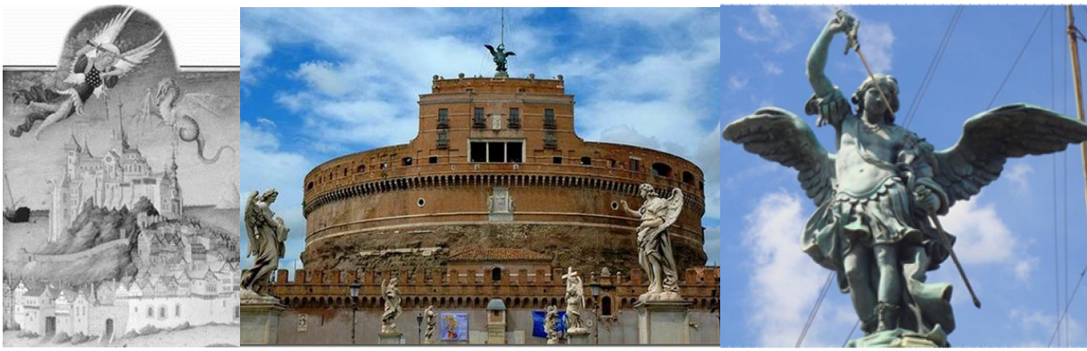
1. Архангел Михаил и Его победа над Англичанами. 2. Замок Сан-Анджело в Риме. 3. Фигура Ангела на вершине Замка Ангела, вставляющего меч в ножны.