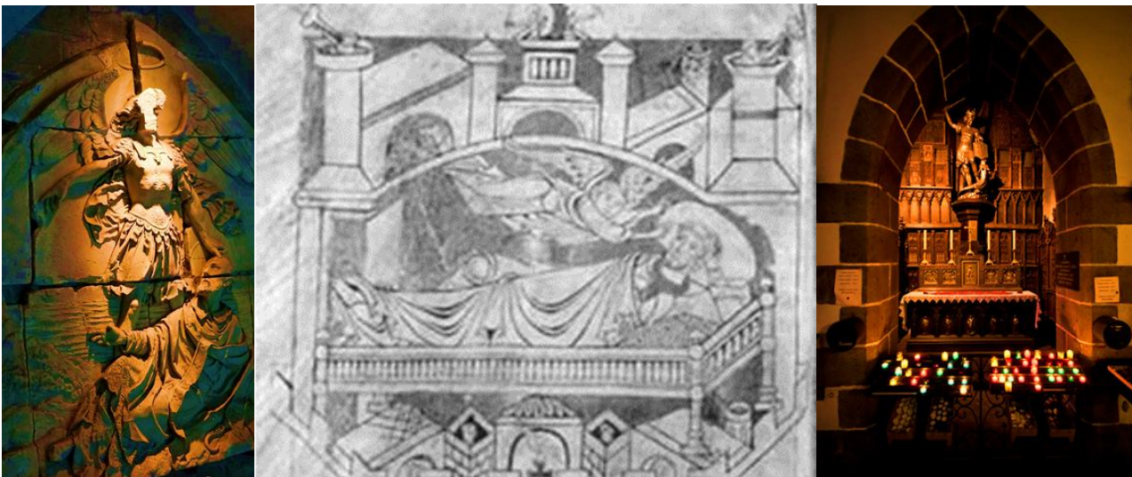
1. Рельеф внутрі монастыря с чудом Св. Обера. 2. Чудо Святого Обера. 3. Церковь в монастыре, где можно помолиться и поставить свечку.