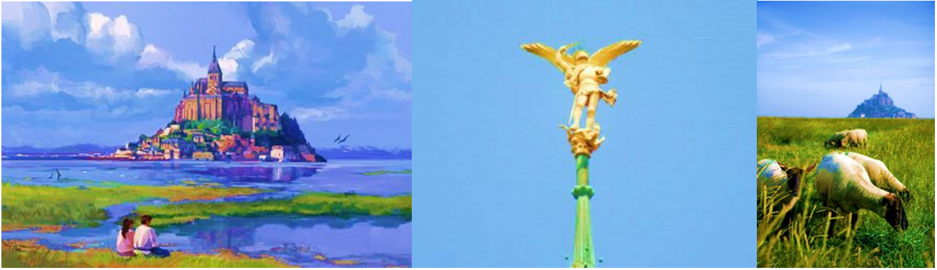
1. Замок Архангела Михаила. 2. Спиль Замка. 3. Овцы и Замок Святого Архангела.