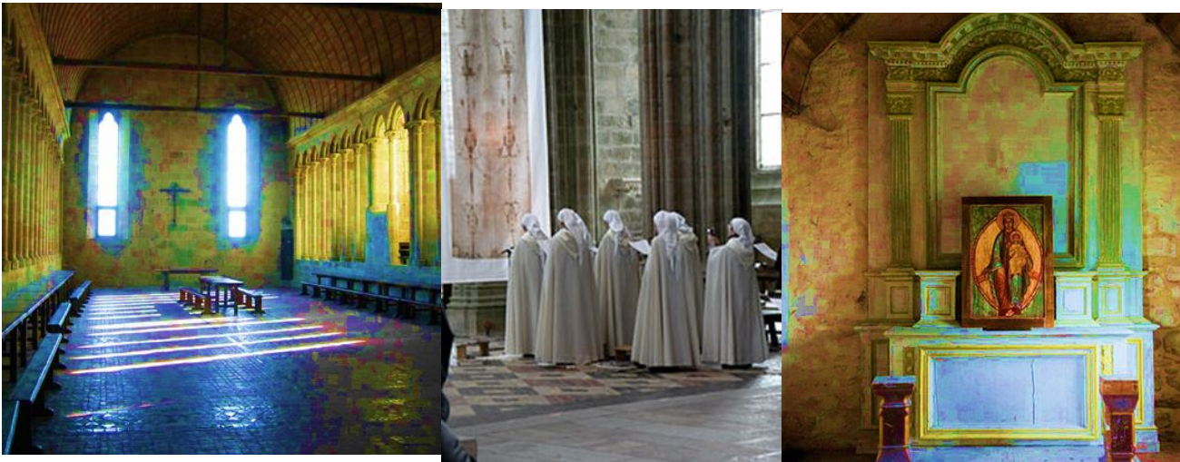
1. Внутрі Аббатства. 2. Монашки Монастыря. 3. Одна из его молельнь. 2.