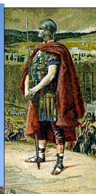
1. Усекновение главы Св. Лонгина. 2. Св. Лонгин, Брага Португалия. 3. Святой Лонгин.