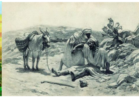
1.Самаритянка (Генрих Семирадский, 1890) 2.Добрый Самаритянин (Бакалович Степан Владиславович, 1898).