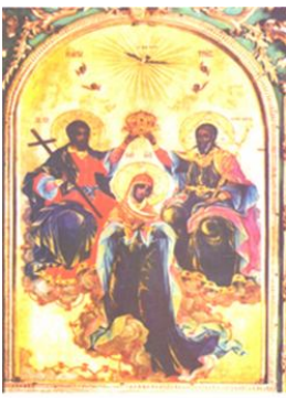
Св. Троица St. Trinity

Святая Троица, естественно, в Святом Духе, имаче невозможно!