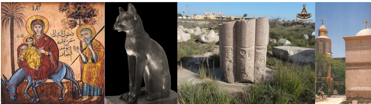
1. Начало пути(Церковь Святого Сергия, Египет). 2. «богиня Бастет в образе кошки - идол.