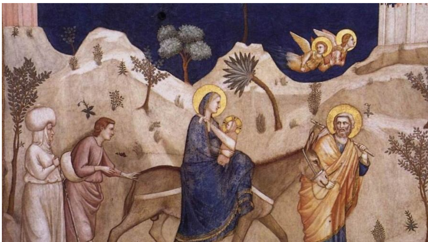
Бегстве Святого Семейства в Египет с сыном Иосифа Иаковом и прислугой (Джотто)