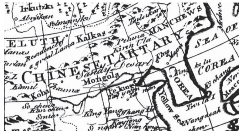
Фрагмент карты русской Великой Тартарии из Британской Энциклопедии издания 1771 г.

Области и народы Лумин, Лича-путь, Ломан. Город Лашуй.