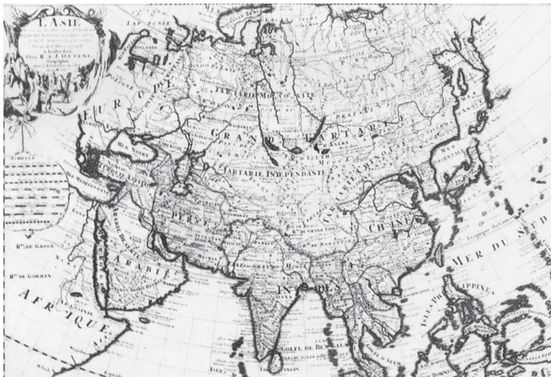
Согласно картам, размещённым в Британской Энциклопедии 1771 г., Сибирь (Великая Тартария) в середине XVIII в. – самостоятельное государство со столицей в Тобольске. ВЕЛИКАЯ ТАРТАРИЯ БЫЛА САМОЙ БОЛЬШОЙ СТРАНОЙ В МИРЕ. Название «Тобольск» на этой карте приведено в форме ТОБОЛ: прямо как в Библии. Напомним, что в Библии Русь названа РОШ, МЕШЕХ и ФУВАЛ, т.е. Рос, Москва и Тобол.

(По страницам книги: Носовский Г.В., Фоменко А.Т. Пугачёв и Суворов. Тайна Сибирско-Американской истории. М., «Аст», 2012)